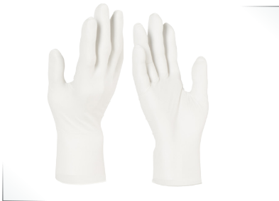
Gants en nitrile de salle blanche

Le Protect'Kit contient tout le nécessaire pour assurer le respect des gestes barrières. N'hésitez pas à nous demander la fiche technique.