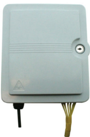
Boîtier mural optique équipé de 12 raccords et pigtails SC-APC